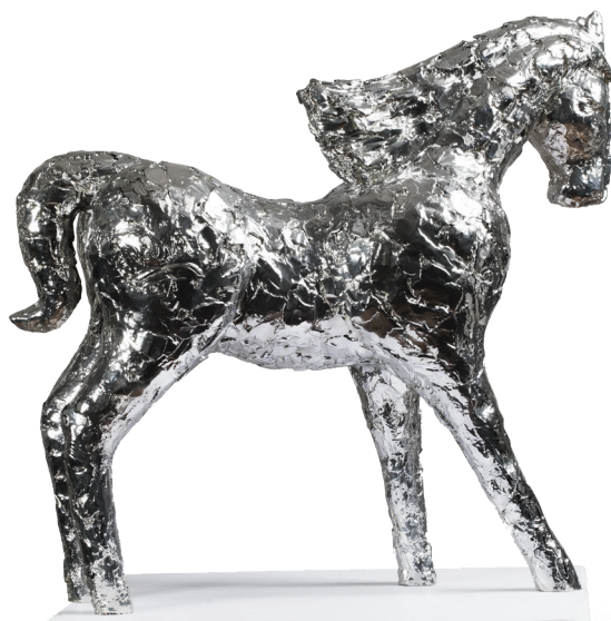
Cheval - Bronze - Patine poudre d'argent