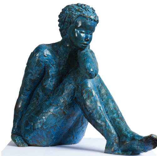
Bahia - Bronze patine bleue