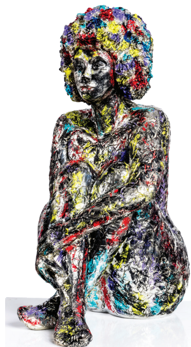
Angela pop - Résine peinte à la main