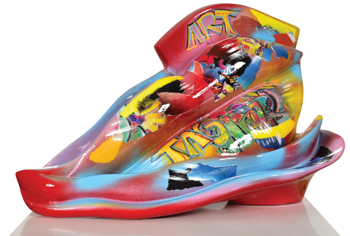
Bouche pop art - Résine peinte à la main