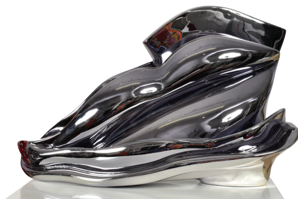
L'art du silence (GM) - Bronze