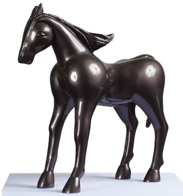
Cheval - Résine

Être en accord avec elle-même pour demeurer absolument dans une démarche artistique sincère. Elle consacre une grande importance aux symboles dans sa pratique artistique.