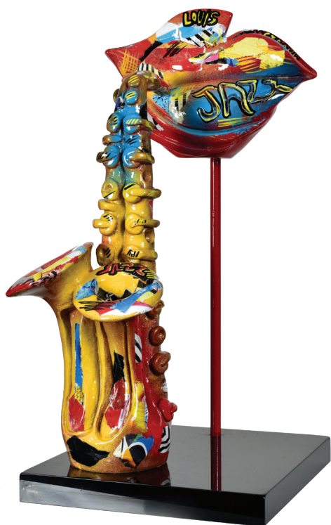
Bouche jazzique - Résine peinte à la main