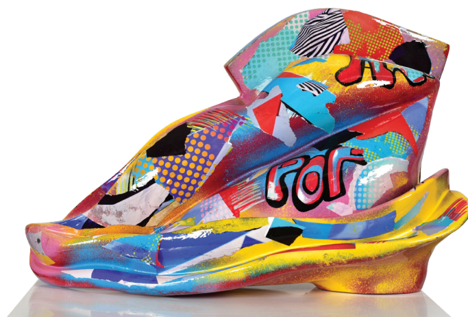
Bouche pop art - Résine peinte à la main

« Etre artiste, c'est accepter de se dévoiler. C'est capter tout ce qui nous entoure et qui habitera nos œuvres. C'est véhiculer un engagement, une idée. C'est aussi apporter un regard sur le monde. »