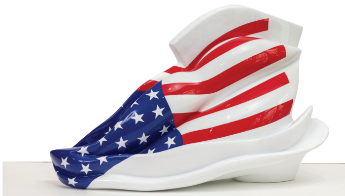
Bouche USA (GM) - Résine peinte à la main